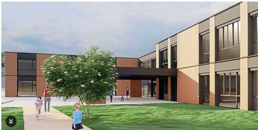
Der Neubau der Grundschule Gartnisch droht immer teurer zu werden, das Investitionsprojekt läge nach den jüngsten Baukostensteigerungen bereits bei 15,6 Millionen Euro.