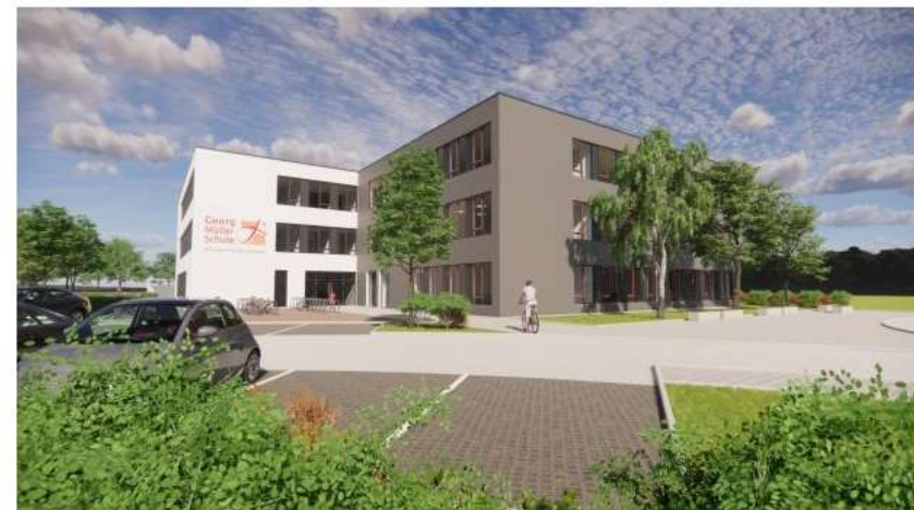
Ein Neubau auf der grünen Wiese: Auf der freien Fläche neben dem heutigen Altbau soll das dreigeschossige Gebäude in Form zweier ineinander verschachtelten Quader entstehen.